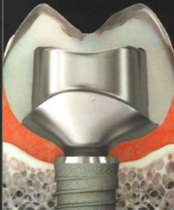
INDIVIDUELLES ZWEITEILIGES ABUTMENT (Klebebasis und ZrO 2 -Aufbau)